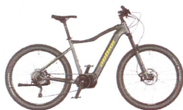
ELEVATION 29 2020